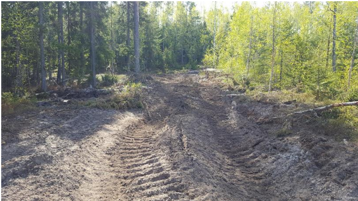
Foto 3. Sönderkört område som avsatts för att skydda groddjurens livsmiljö

En stor del av området som satta av för grodor har också körts sönder och använts för uppställning av skördare, skotare, traktorer och farmartankar (Se foto 3).