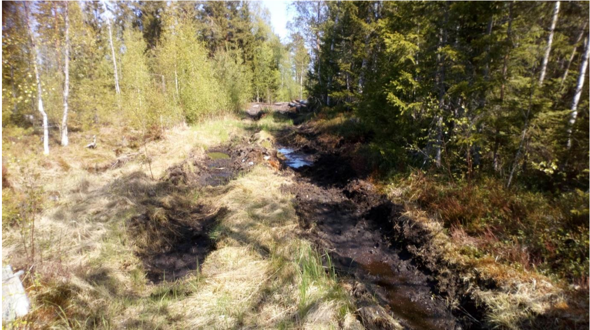
Foto 2. Gammal skogsstig med groddförekomster som körts sönder med skogsmaskiner.

En stor del av området som satta av för grodor har också körts sönder och använts för uppställning av skördare, skotare, traktorer och farmartankar (Se foto 3).